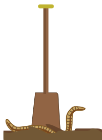
Gestion des sols

L'expérience de SERGE BALLOT EARL DES COTEAUX D'HUGIER (70)