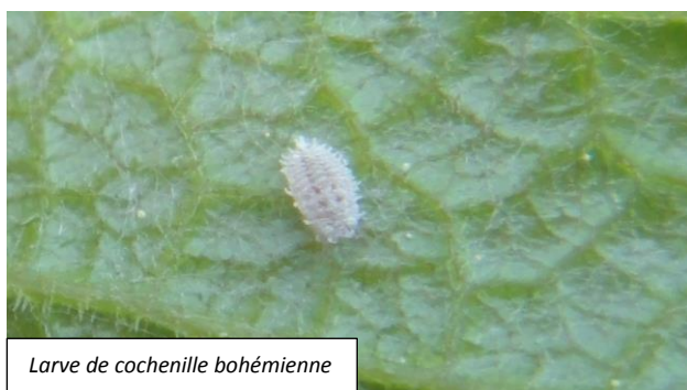
Larve de cochenille bohémienne