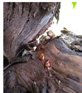
Cochenilles du cornouiller