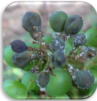
Rot gris et Rot brun

Sur 241 observations (TNT exclus), 90% des parcelles demeurent à ce jour indemnes ou très faiblement atteintes (0 à 5% de grappes avec rot gris ou rot brun). L'évolution la plus importante concerne la plupart du temps des parcelles déjà dégradées sur feuilles la semaine dernière et qui présentaient quelques symptômes de rot-gris. Dans ces situations, du rot-brun a fait son apparition. Signalons également quelques cas où l'attaque de mildiou sur grappes s'est déclarée depuis le dernier BSV. Le Mâconnais, la Côte Chalonnaise, le Jura et dans une moindre mesure la Côte d'Or sont les secteurs les plus touchés mais la situation est très hétérogène d'une parcelle à l'autre. Les intensités d'attaque demeurent faibles dans la majorité des cas avec tout au plus quelques portions de grappe atteintes.