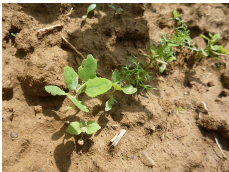
amarante, chénopodes et éthuses - Photo 04/06/2018 A Ney

Chénopodes, amarantes, fumeterres, renouées (tous les types), euphorbes réveil-matin, panics, repousses de la culture précédente.