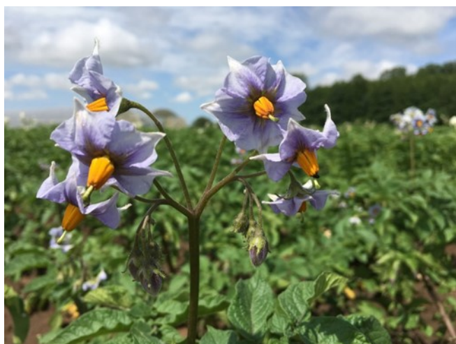
Auxonne 04/06/2018

La parcelle la plus tardive présente des plants tout juste sortis de terre, pour les autres, les premières fleurs s'ouvrent et la tubérisation va du grossissement des stolons à 70%.