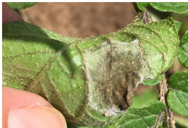
Auxonne 04/06/2018