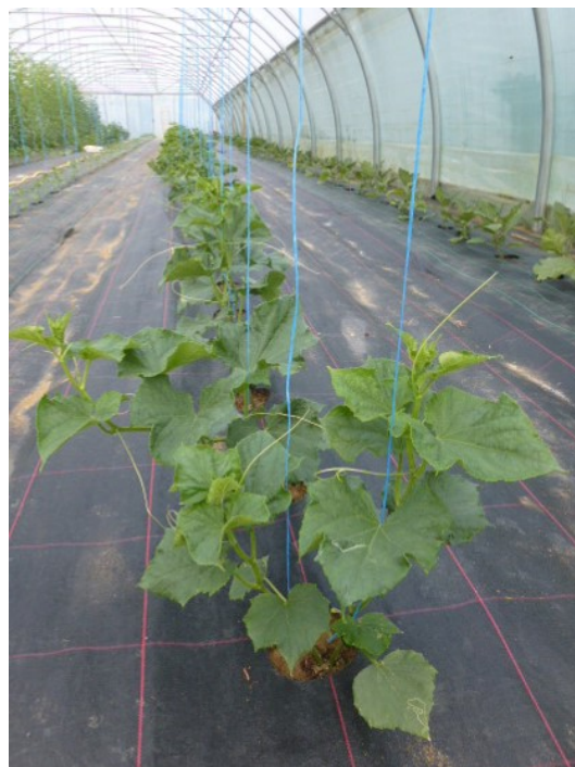
Concombres - GROSBOIS et LES AUXONS - Photos M. DULAIS, A. NEY