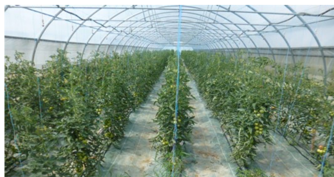
Tomates sous abris plantés semaine 15 et 14 SAINT-LAMAIN et GY