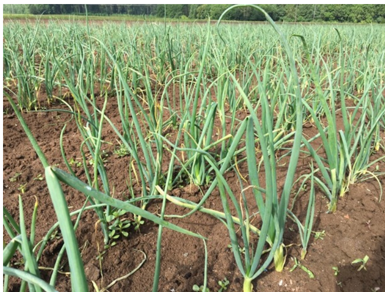
Oignons repiqués, Auxonne, 04/06/2018

Les oignons repiqués sont au stade 7/8 feuilles. Les oignons semés sont au stade 4/5 feuilles.