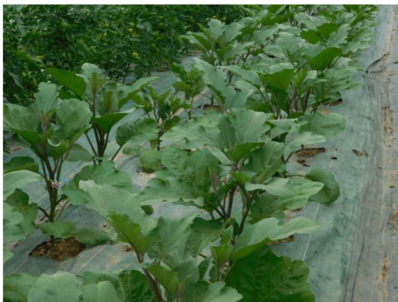
Aubergines sous abris, SAINT-LAMAIN et AUGERANS