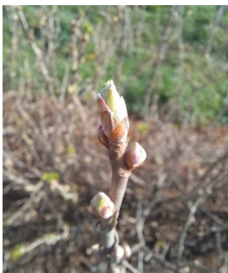
▲ Noir de Bourgogne entre les stades B1 et B2, en plaine

Les températures devraient continuer à fluctuer entre journées chaudes et journées froides dans les 10 prochains jours avec quelques périodes de pluie de 10mm.