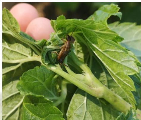
◀ Pousse symptomatique de pucerons cendrés "nettoyée" par un forficule (ou perce-oreille)

Les pucerons cendrés sont toujours présents mais n'ont pas évolué en nombre. De nouveaux auxiliaires prédateurs sont apparus (forficules) et semblent suffisants pour les réguler.