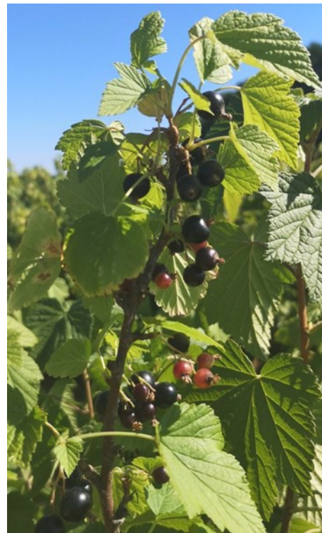
▲ NB en plaine, le 13 juin

Étant donné les conditions climatiques annoncées, il existe un risque d'échaudage pour les fruits, particulièrement pour les fruits vérés exposés au soleil.