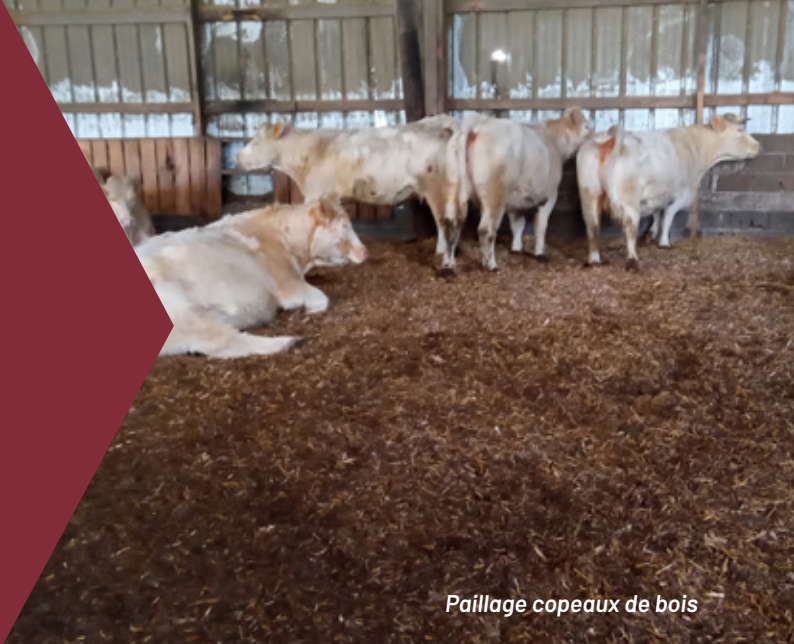
Paillage copeaux de bois