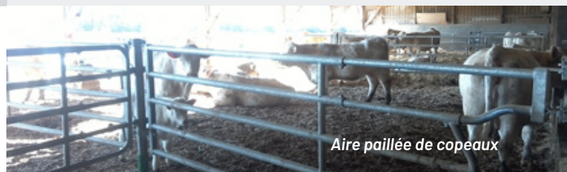
Aire paillée de copeaux